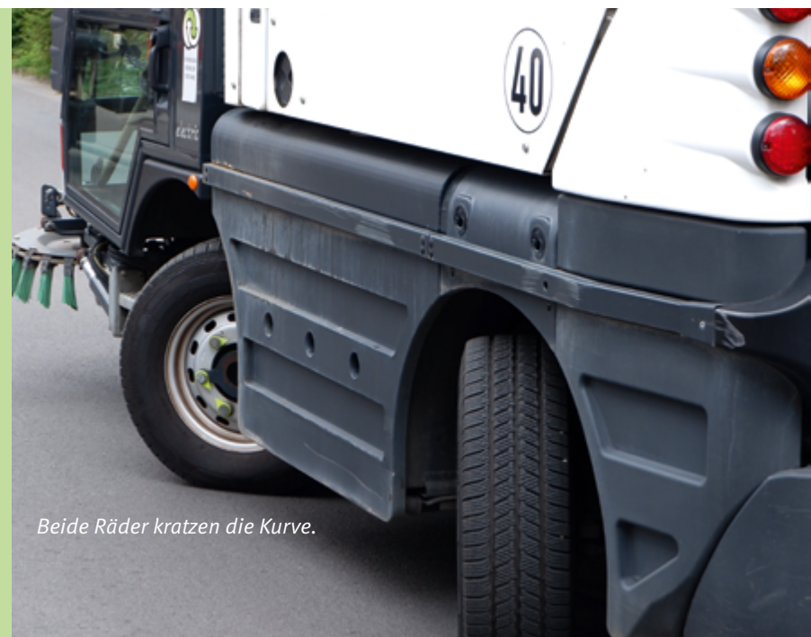
Beide Räder kratzen die Kurve.

Einige unserer Fahrzeuge haben nicht nur eine lenkbare Vorderachse, bei Bedarf kann auch bei der Hinterachse eine Lenkung eingeschaltet werden. Für enge Wendekreise ist das sinnvoll, denn der reduziert sich um ca. 1/3 von rund 6 m auf ca. 4 m. Dadurch ist die Kleine noch wendiger und kommt auf Fußwegen, Radwegen und in der Fußgängerzone überall durch.