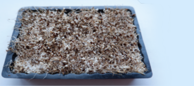
Was nach der Kresse übrig bleibt: ein Fall für die Restabfalltonne ...

* Achtung: Von März bis einschließlich Oktober schließen die Wertstoffhöfe um 18.00 Uhr. ** Keine Kartonage, kein Papier, kein Glas, keine Verpackungen (Gelbe Säcke)