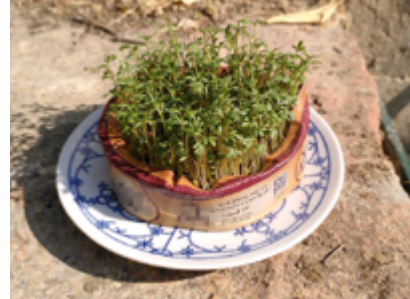
... oder komplett verwertbar